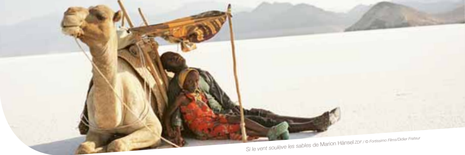
Si le vent soulève les sables de Marion Hänsel