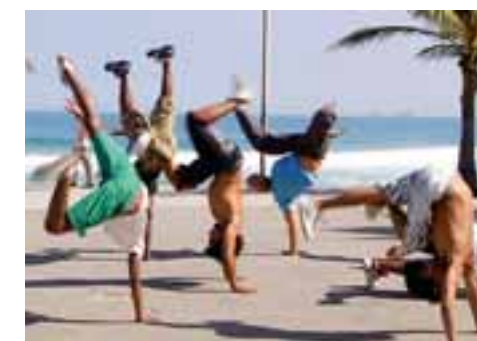
Rio, Gravité Zero, avec les danseurs présidents de la Companhia Urbana de Dança