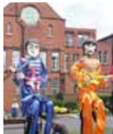
Let it beat, Liverpool ZDF / © Irene Langemann/Lichtfilm