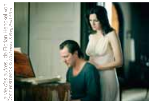
La vie des autres, de Florian Henckel von Donnersmarck