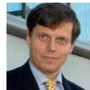
Gottfried Langenstein, Président d'ARTE