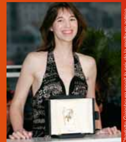
Charlotte Gainsbourg reçoit le prix de la meilleure actrice au festival de Cannes en 2008

Prix d'excellence cinématographique, Sundance, 2008