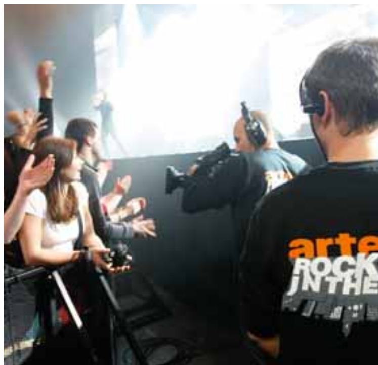
ARTE Rock in the City, octobre 2008

Outre-Rhin, la Chaîne a notamment pris part au Max-Ophüls-Preis de Sarrebruck, aux festivals du documentaire et du film de Munich, aux festivals du court-métrage d'Oberhausen, Hambourg et Dresde, au Festival du film documentaire et d'animation (Dok) de Leipzig, au festival du film de Hof, à la Semaine du film de Duisbourg et à la Semaine du film français à Berlin. Par ailleurs, ARTE a affirmé son identité culturelle européenne à l'occasion de la Mostra de Venise, du Festival Visions du Réel de Nyon ou encore du Festival international du film de Locarno. Le stand d'ARTE aux salons du Livre de Francfort, Leipzig et Paris a également attiré de nombreux visiteurs.