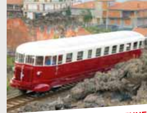
Un billet de train pour..., série documentaire en dix parties