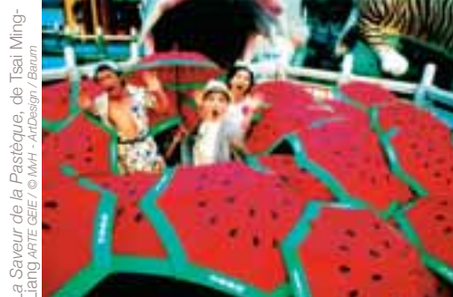
La Saveur de la Pastèque, de Tsai Ming-Liang

Chaîne de création, ARTE s'associe le plus souvent possible aux grands événements artistiques qui ont lieu en Europe. Ainsi, en 2008, la Chaîne a retransmis la spectaculaire Traviata en direct de la gare de Zurich, la traditionnelle Folle Journée de Nantes Schubert dans tous ses états , le Concours de la Reine Elisabeth à Bruxelles ou encore la journée consacrée à la danse à l'occasion de la Biennale de Lyon. ARTE est aussi très présente dans les tendances d'aujourd'hui. Le grand concert ARTE Rock in the City au Zénith de Strasbourg, rassemblait les stars incontournables de la scène rock internationale: Sharleen Spiteri, The kills, Camille ou encore Ayo.