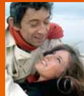
Slogan avec Serge Gainsbourg et Jane Birkin

Grâce à la complicité d'Amanda Lear et de Philippe Manœuvre, ARTE a revisité en 2008 la décennie 70, dix années de ruptures, d'expérimentations tous azimuts, et de révolution permanente. Concerts et portraits des grandes icônes se sont succédé, Serge Gainsbourg, Bob Dylan, James Brown, Pink Floyd, Abba, David Bowie, Bob Marley..., accompagnés des films les plus emblématiques de cette époque, de Love story à Emmanuelle ou Shaft .