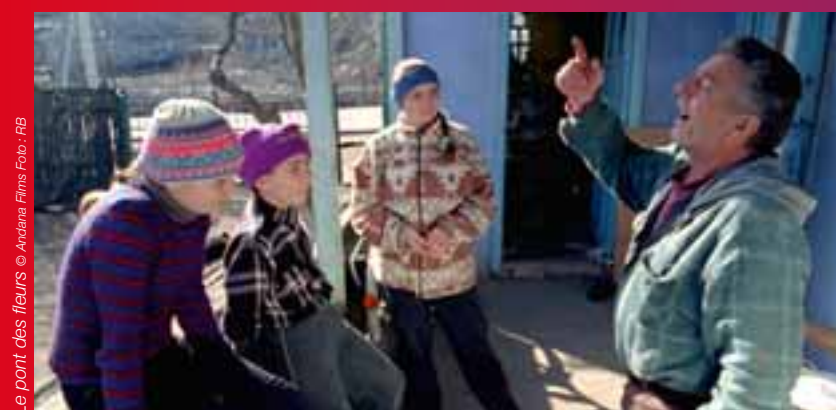
Le pont des fleurs

Médaille Charlemagne pour les Médias Européens pour l'union européenne et la formation d'une identité européenne, Aix-La-Chapelle.