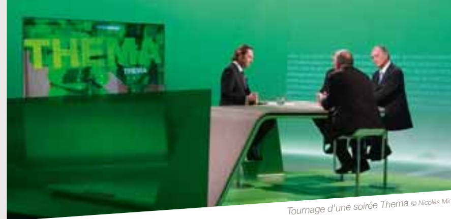
Tournage d'une soirée Thema