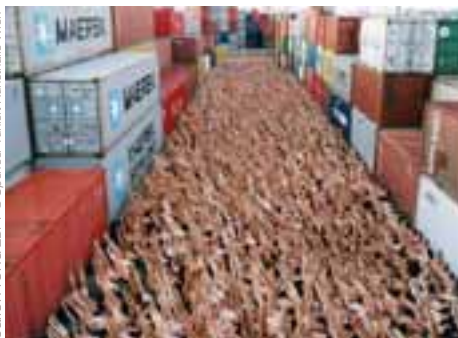
Metropolis Spencer Tunick déshabille le ballon rond ZDF / © Spencer Tunick/Kunsthalles Wien