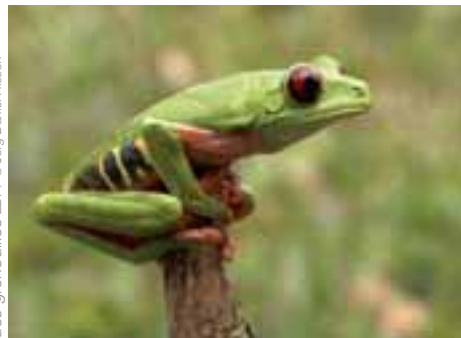
ARTE Découverte, L'arche des grenouilles ZDF / © Jörg Daniel Hissen

Centré sur les grandes tendances culturelles des dernières décennies, le Documentaire culturel , qui élargit depuis fin 2007 la palette des documentaires d'ARTE, s'est intéressé à la polémique autour du Business des musées , tel le Louvre à Abou Dhabi. Dans les années 30, les films de montagne ont fait fureur auprès des cinéastes allemands. Les Français ont attendu l'après-guerre. C'est ce phénomène que raconte Ils ont filmé la montagne . Enfin, Liverpool - Beat City , dévoile toutes les facettes de la ville des Beatles, très éprouvée par des années de crise et capitale européenne de la culture en 2008.