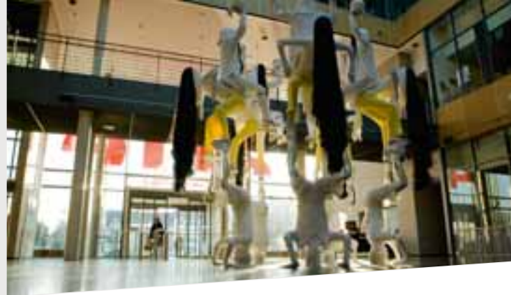
Exposition Firman, ARTE