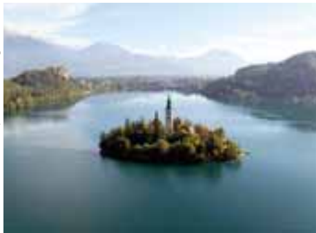
L'Europe à vol d'oiseau ARTE

Magazine d'actualité internationale, ARTE Reportage , proposé chaque samedi à 19h, va étudier sur place les grands conflits, latents ou avérés, qui agitent le monde. Ainsi, en 2008, la rédaction s'est penchée sur les tensions dans le Caucase, sur la violence sociale en Chine à l'occasion des Jeux Olympiques ou encore sur l'emprise grandissante des écoles coraniques sur le système scolaire du Pakistan. Malgré les pressions exercées sur les journalistes, ARTE Reportage n'a pas hésité non plus à se rendre au Niger, l'un des pays les plus pauvres de la planète, et pourtant aussi un des plus gros centres de production d'uranium au monde.