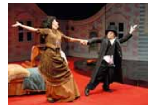
Mabou Mines DollHouse © Michel Lénier Foto: ARTE France