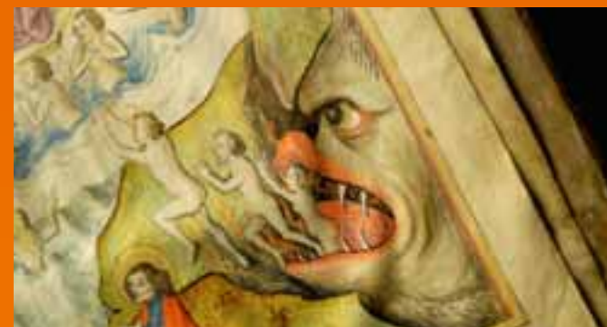
L'Apocalypse de Jérôme Prieur et Gérard Mordillat

Après Corpus Christi et L'Origine du Christianisme , Jérôme Prieur et Gérard Mordillat ont exploré L'Apocalypse , le dernier livre du Nouveau Testament. Un série documentaire en douze chapitres qui s'appuie sur ce grand texte pour raconter la christianisation de l'empire romain entre le I er et le V e siècle.