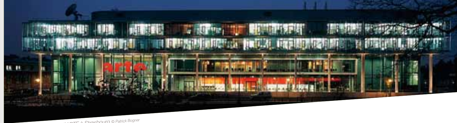
Siège d'ARTE à Strasbourg