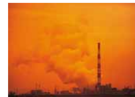
La planète bleue, bilan de santé BR