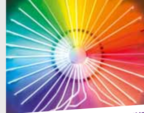
Exposition Firman, ARTE