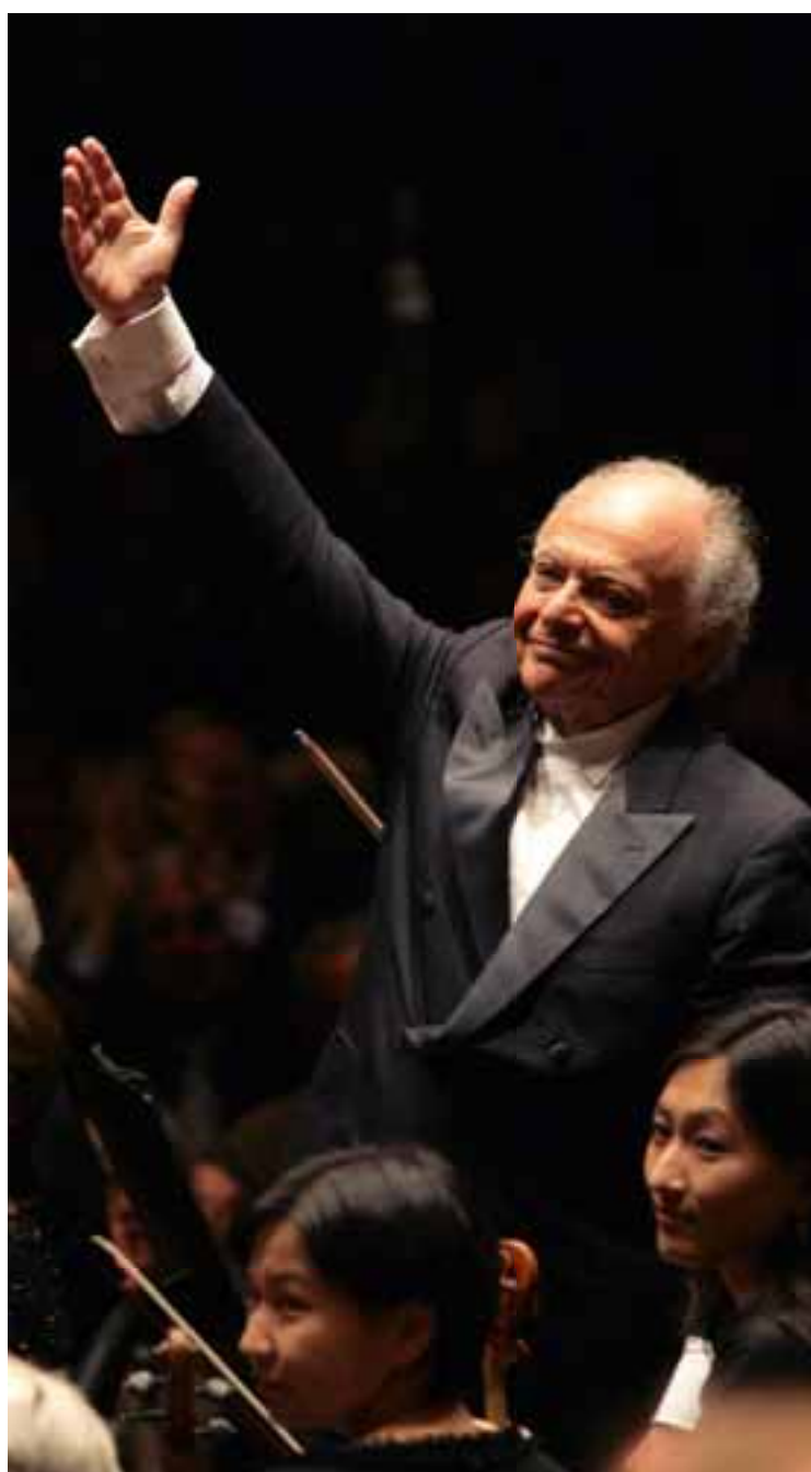
Concert de l'Orchestre Philharmonique de New-York à Pyongyang, le 26 février 2008