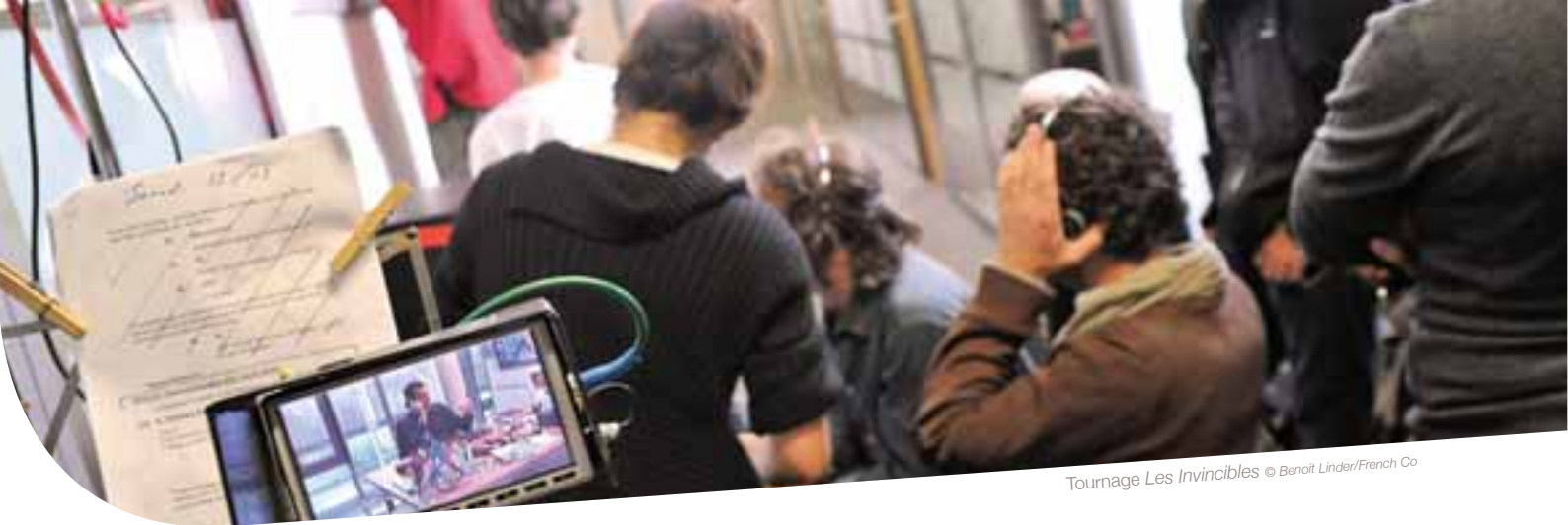
Tournage Les Invincibles