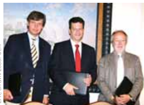
Gotfried Langenstein et Jérôme Clément signent un accord de coopération avec Christos Papanicolaou, Président de l'ERT, en avril 2009.

En Allemagne, 150 manifestations ont été organisées en 2008 et au cours du premier semestre 2009, avec le concours de 60 partenaires. ARTE s'est associé, en tant que partenaire Média, au Festival international africain de Würzburg, au Festival Théâtre du Monde de Halle, à la grande exposition Kandinsky au Lenbachhaus de Munich et au Festspielhaus de Baden-Baden. Au vu des succès des années précédentes, ARTE a poursuivi sa collaboration avec le Martin-Gropius-Bau à Berlin, le Staatliches Museum Schwerin et le réseau des Maisons de la Littérature.