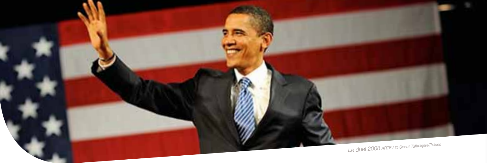
Le duel 2008 ARTE / © Scout Tufankjian/Polaris