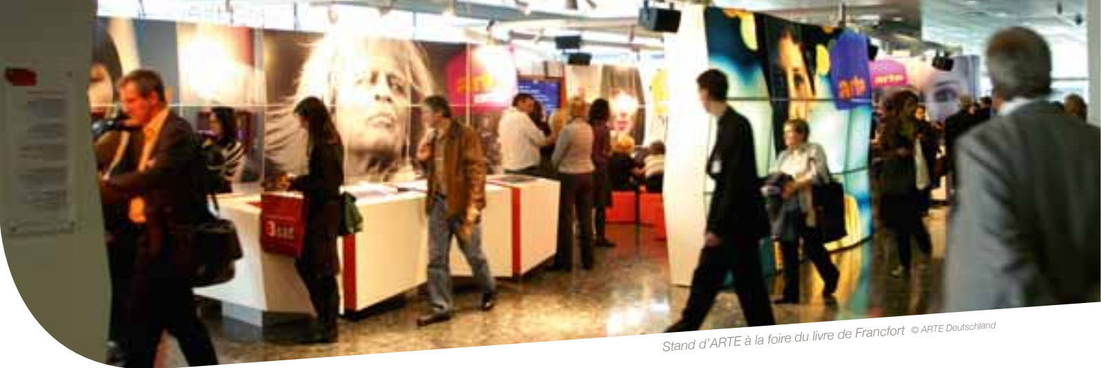
Stand d'ARTE à la foire du livre de Francfort