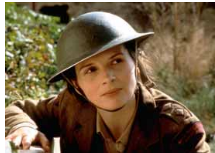
Le patient anglais avec Juliette Binoche

Articulée autour de grands films de cinéma et de documentaires éclairants, la Thema du dimanche a su séduire son public. Ainsi les fans de Sidney Pollack, disparu en 2008, ont pu revoir son inoubliable Jeremiah Johnson , suivi d'un long portrait du réalisateur. La soirée Sahara, la passion du désert proposait Le Patient anglais d'Anthony Minghella, illustré par un documentaire Sur les traces de Laszlo Almazy , l'aventurier qui inspira le personnage principal. Qu'eût été Louis XIV sans Versailles? Dans la soirée Louis XIV, le roi Soleil , le très beau film de Gérard Corbiau Le Roi danse précédait une visite détaillée des célèbres jardins de Le Nôtre. Les puissants de ce monde ont aussi leur place dans la Thema du dimanche . Ainsi, La saga des grandes familles revenait sur le mystère Von Bülow et décryptait les codes et rites de la grande bourgeoisie industrielle.