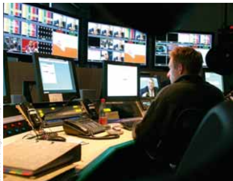
Salle de montage

Nous mobilisons le meilleur de la technologie pour proposer aux téléspectateurs une diffusion d'une qualité inégalée à l'antenne et une présence accrue sur les nouveaux vecteurs de diffusion. Le défi est considérable, car les équipements doivent être renouvelés et les équipes formées. En 2008, ARTE a réussi le passage à la haute définition en assurant une diffusion 24h/24 en HD en France et en Allemagne, une valeur ajoutée qui insuffle au petit écran un nouveau potentiel de séduction par rapport à la réception standard. ARTE renforce sa présence sur le câble analogique en Allemagne, prépare le passage au tout numérique de la diffusion terrestre en France et reste à l'affût des nouveaux modes de consommation audiovisuelle. La Chaîne investit les vecteurs de diffusion d'avenir comme la télévision à la carte sur internet et développe des interfaces ergonomiques pour une diffusion sur les téléphones portables, iPhones ou encore écrans hybrides.