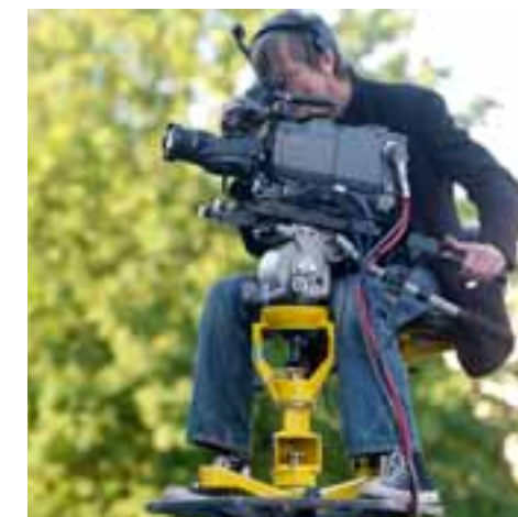
Tournage d'une soirée Thema

En Allemagne, un changement de transpondeur s'est avéré nécessaire en mars 2008 afin d'augmenter la capacité pour une diffusion sur écrans plats avec une meilleure qualité de l'image et la possibilité d'une retransmission en son Dolby numérique. Etaient concernés les 30 % de foyers allemands recevant le signal allemand d'ARTE en numérique sur le câble et sur le satellite. Le changement de fréquence qui en a résulté a occasionné des problèmes de réception et une érosion momentanée de l'audience, aussitôt jugulée par une vaste campagne de communication incitant les téléspectateurs à reprogrammer ARTE en activant la recherche automatique des chaînes. Fin 2008, plus de 80 % des foyers avaient procédé à l'initialisation.