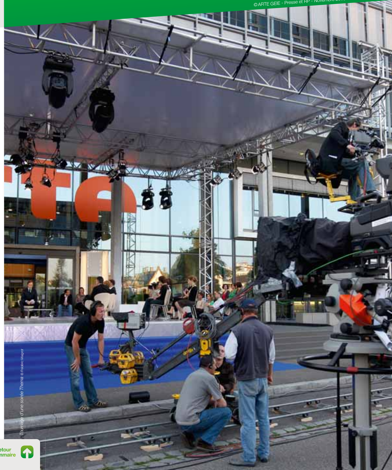
Tournage d'une soirée Thema © Frédéric Magrat

Photo couverture: © Albert Font / Nina Marquina © ARTE GEIE - Presse et RP - Novembre 2009