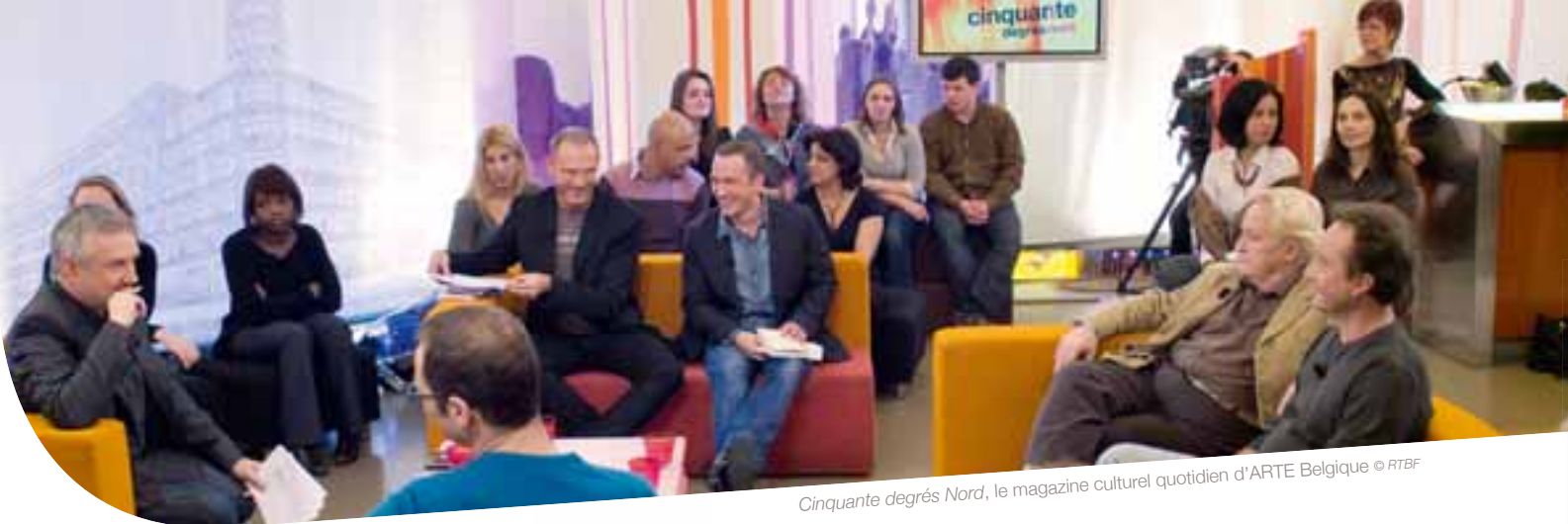
Cinquante degrés Nord, le magazine culturel quotidien d'ARTE Belgique