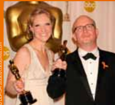
Alex Gibney et Eva Orner à la 80 e cérémonie des Oscars, Hollywood, 2008

César du meilleur film documentaire, Paris, 2009