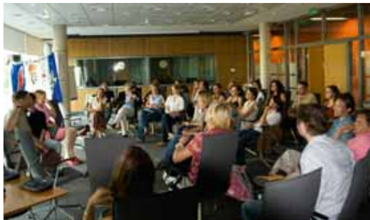
Séminaire interculturel du Groupe ARTE, juin 2009

Les efforts de restructuration se poursuivent afin de redéployer les collaborateurs de la Chaîne sur les activités prioritaires. L'accent est mis sur la réorganisation des services techniques, de l'activité multimédia et des unités de programmes.