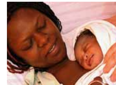
Douleur, cruauté compagne, de Gesa Berg NDK

Thema a scruté la société et s'est interrogé sur les grands enjeux politiques, socio-économiques et scientifiques. L'autobiographie non autorisée du plus controversé des présidents des Etats-Unis, Being W. , diffusée avant les élections américaines, a réuni près de 1,2 millions de téléspectateurs. A la veille de l'ouverture des jeux olympiques, ARTE a plongé Au cœur de la Chine , sondé les ambitions du pays-continent et pesé les conséquences de la croissance à tout prix. Des enquêtes approfondies ont donné un coup de projecteur sur des sujets qui préoccupent chacun d'entre nous, comme l'évolution du Moyen-Orient, les changements climatiques ou encore le rôle réel de la mafia. Les grands sujets de santé ont aussi été très présents dans la programmation 2008, comme Dépression, à la recherche du moi perdu ou La mémoire, au défi de l'âge .