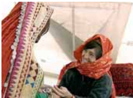
Chaghcharan, un hospital afghan (4/5)