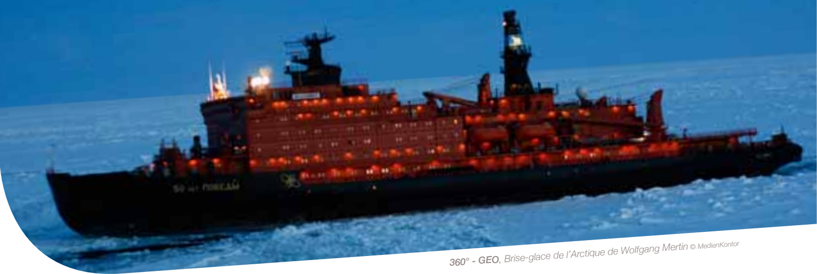
360° - GEO, Brise-glace de l'Arctique de Wolfgang Mertin © MedienKontor